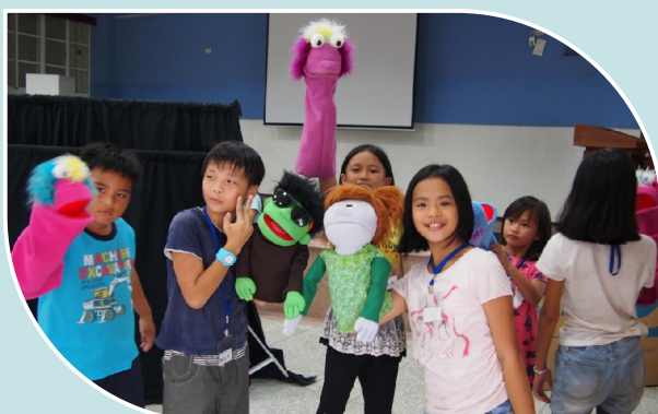
啄木鳥-手偶戲劇營

(2)走進生態大書裡：每日晨間戶外運動、打掃，享受陽光、尋找驚奇~在水黃皮樹下被風吹落