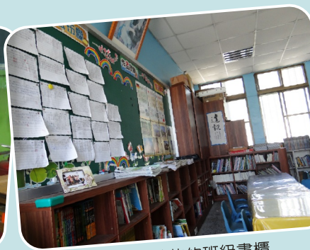
飛碟電台募款的班級書櫃