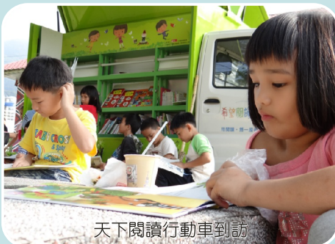
天下閱讀行動車到訪