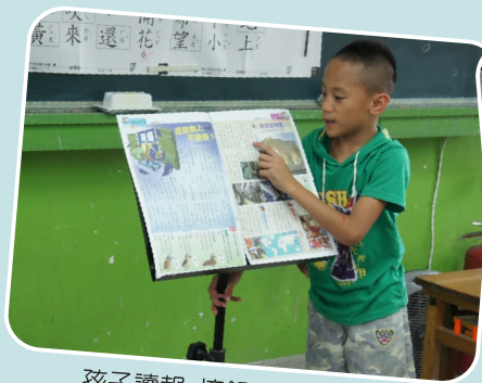
孩子讀報 摘錄重點 並分享