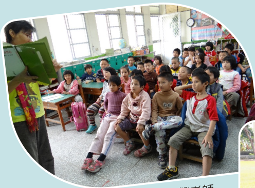
早療協會乃馨老師故事時間

大量引進外埠資源，文字夠感性，活動多元，可惜閱讀活動缺乏整體感。活動橫向聯繫較為不足。