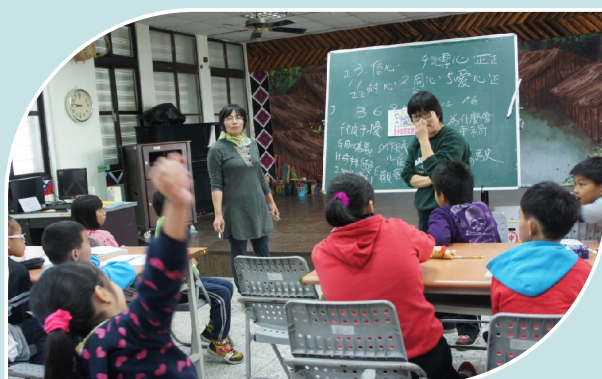
啄木鳥協會每週三的品格故事