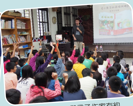
誠品悅讀趣－與信子作家有約