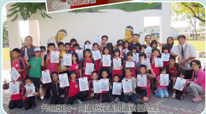
升期頒獎—閱讀桃花源閱讀績優師生