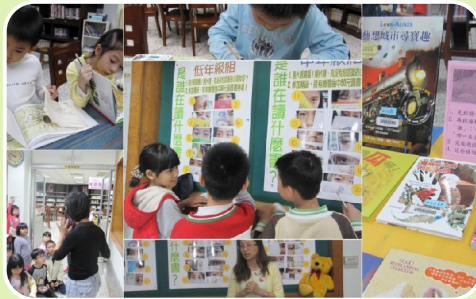
猜猜是誰在讀什麼書有獎徵答 閱讀猜謎深受師生喜愛