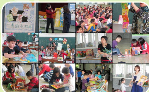
低年級圖書萬花筒活動 啟動孩子對書的興趣與情感