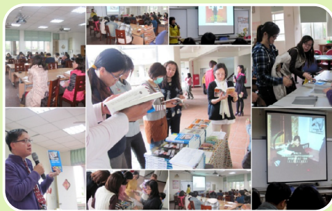
每學期舉辦教師閱讀研習與親職閱讀講座