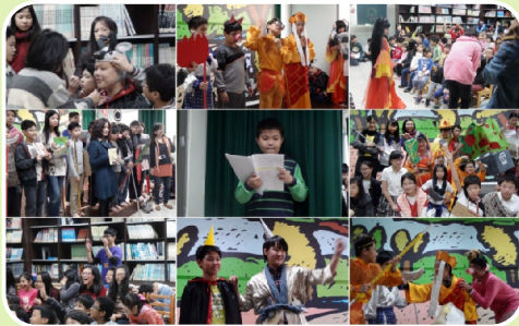
高年級國語課文西遊記閱讀創作演書