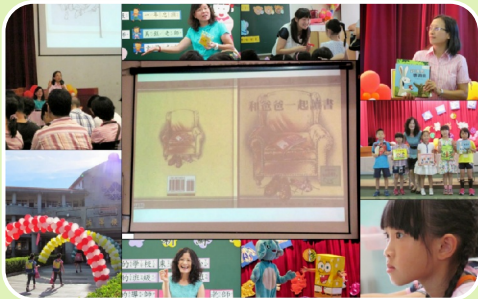
閱讀推動教師在新生開學日向家長宣揚親子共讀的價值