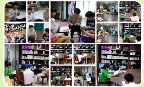
小團體讀書會由專人陪伴唸讀與聊書 是弱勢孩童的最愛