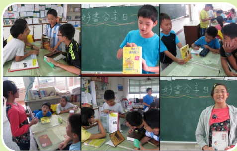
導師運用零碎時間鼓勵孩子以小組分享介紹愛書