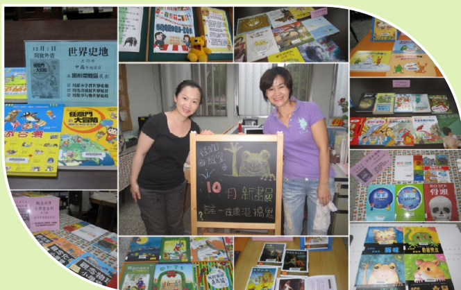
圖書館每月新書展是常態性活動 深受師生喜愛

(2)閱讀推動教師入班教學：閱讀推動教師根據校務行事及各年級主題課程，每學期擬定授課計畫，輪流入班為孩子上閱讀課，提供多元的閱讀觸