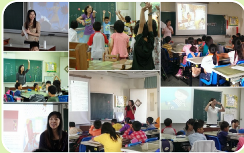
志工家長每週入班說故事是本校例行晨讀活動之一