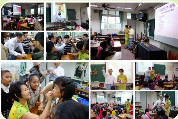
社區家長介紹家族移民歷史融合文化體驗與閱讀教育