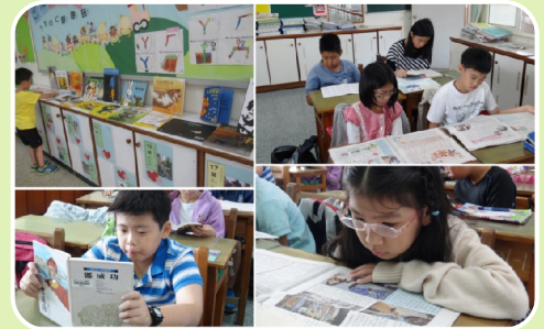
晨讀為師生開啓一天美好的心情

堂熱絡有趣，也滿足孩子塗鴉繪畫的慾望。孩子從學習架構文章的思維中，進一步提升寫作能力。