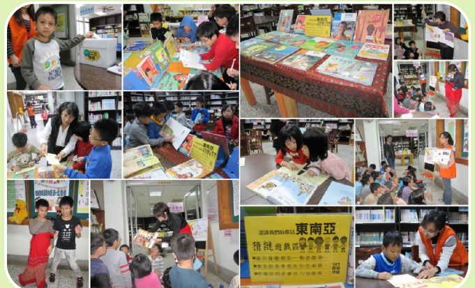
國際教育認識東南亞閱讀活動 社區家長協同教學