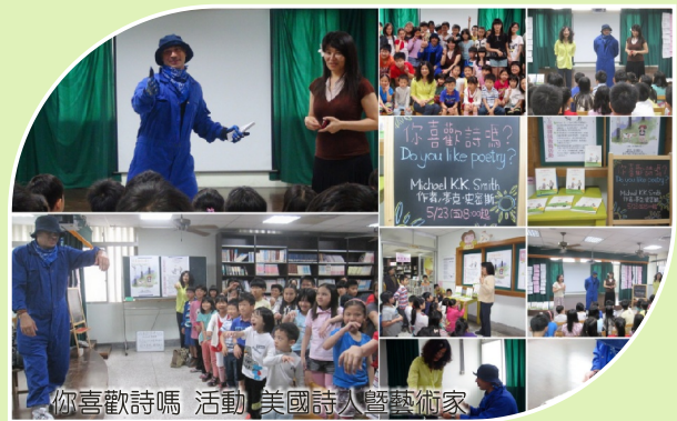
你喜歡詩嗎 活動 美國詩人暨藝術家 唸書並進行機械舞教學