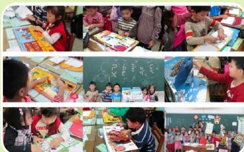
低年級舉辦書的博覽會 孩子動手跟稀奇古怪的書玩