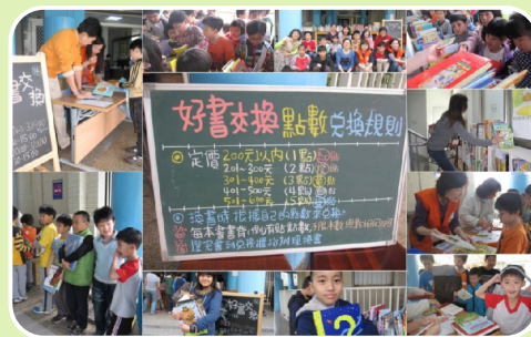
每年的二手童書交換活動為期一週 大人小孩忙得好開心