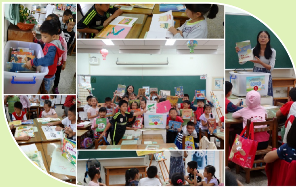
使用公共圖書館書箱 推動班級閱讀