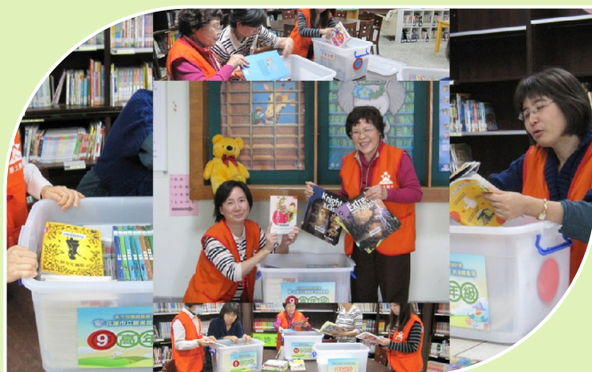
本校積極與市立圖書館合作 推動班級共讀