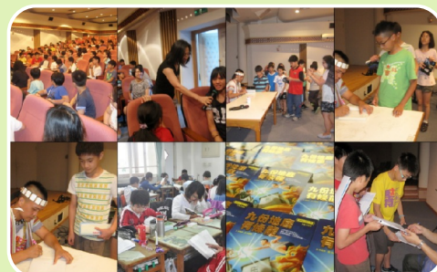
從全班閱讀專書到作家蒞校演講 孩子們熱烈參與