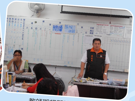
教師期初閱讀課程研討