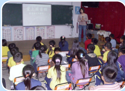
世界書香日－愛上圖書館