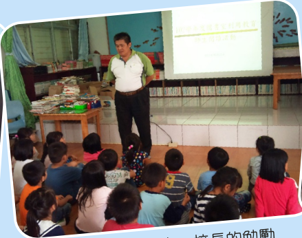
圖書館利用教育－校長的勉勵