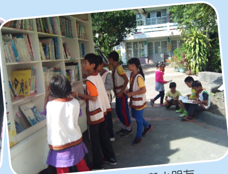
小太陽ㄨㄨㄨ車與小朋友