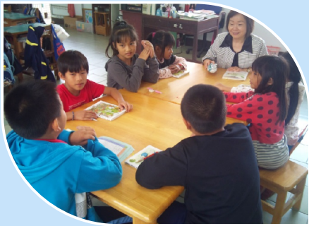
小朋友用心參與班級讀書會