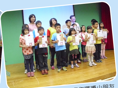
萬榮鄉圖書館查理心提寫作獲獎小朋友