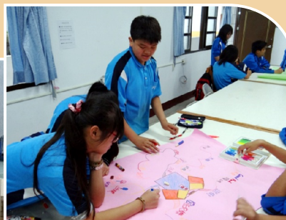
暑期閱讀寫作研習營_心智圖製作