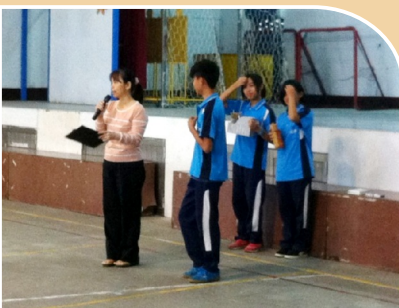
好文閱讀有獎徵答

在閱讀書本的過程中，我們用心陪伴孩子，帶領著孩子走進書中，試著讓孩子貼近古人，試著讓孩子與作者對話，試著讓孩子用他拙拙的畫筆，畫出他想像的書中世界，用他靈活的滑鼠為古詩詞穿上新衣。在閱讀大地的過程中，我們用愛陪伴孩子，讓他們了解他的家鄉，讓他們了解他的鄰里，讓他們因了解而