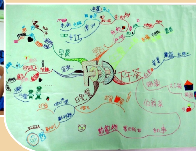
暑期閱讀寫作研習營_心智圖成果