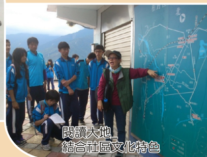
閱讀大地 結合社區文化特色

鼓勵他們做主題研究與小論文的研究，例如：學生為什麼喜歡說髒話及人為什麼要說謊等，也鼓勵孩子對家鄉事物的關懷，研究富里地區有機物的栽培……閱讀家鄉、閱讀大地。