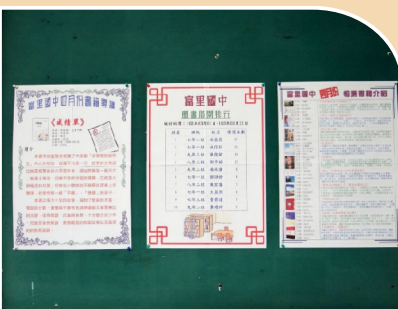
新書介紹、導讀、借閱排行