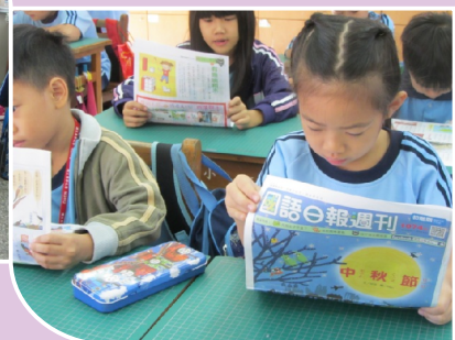
每日晨讀：閱讀報紙