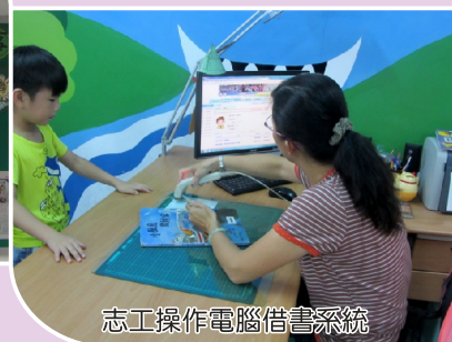
志工操作電腦借書系統