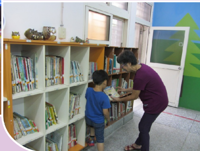
圖書志工協助新生借閱圖書