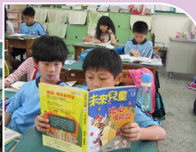
每日晨讀：閱讀雜誌