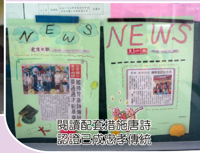
閱讀配套措施唐詩認證已成忠孝傳統