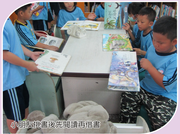
小朋友挑書後先閱讀再借書