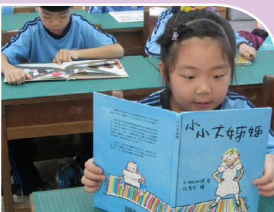
每日晨讀：閱讀書籍