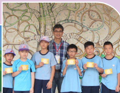
表揚各班閱讀高手