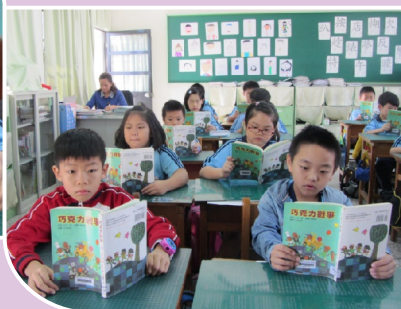
每日晨讀：班級共讀書籍