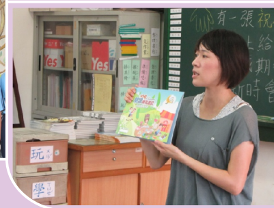
導師向家長說明閱讀手冊