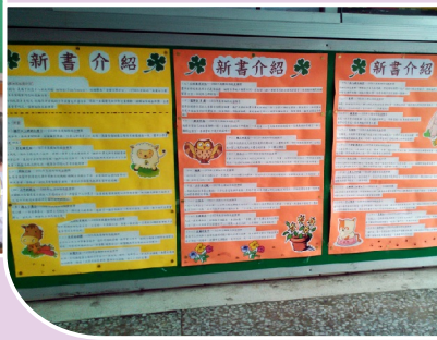
介紹新書吸引學生借書