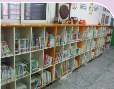
低年級貓頭鷹圖書室標誌