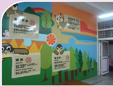
貓頭鷹圖書室牆面亦以貓頭鷹為主題