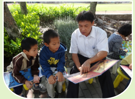
花蓮縣西林國民小學推動【支亞干溪畔的讀書聲】閱讀計畫發展歷程