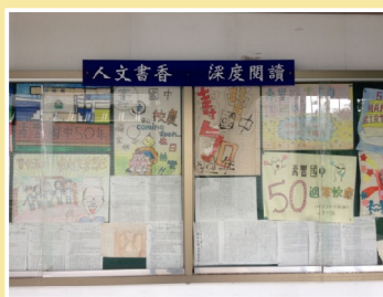
專欄公布學生藝文作品