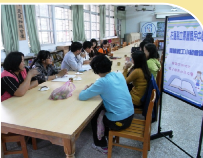
家長閱讀義工小組會議

本校之「壽豐藝文獎」已經進入第十年了，為了提倡本校文學風氣，鼓勵學生從事藝文創作，發揮學生潛能，提升寫作興趣，並配合九年一貫創新教學，