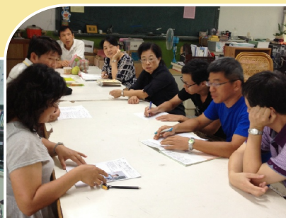
國文教師討論推動閱讀活動