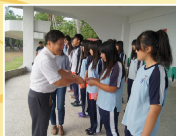
頒發投稿學生獎勵金