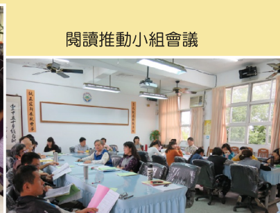
閱讀推動小組會議