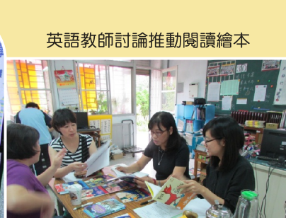
英語教師討論推動閱讀繪本