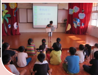
小小說書人活動每週二四上台說書