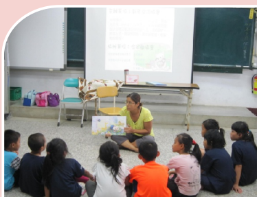
新象故事媽媽到校說故事