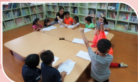
低年級閱讀課認識圖書室