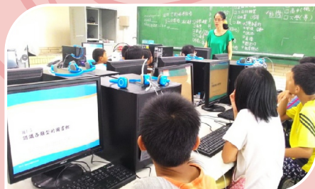
高年級閱讀課認識各類型圖書館