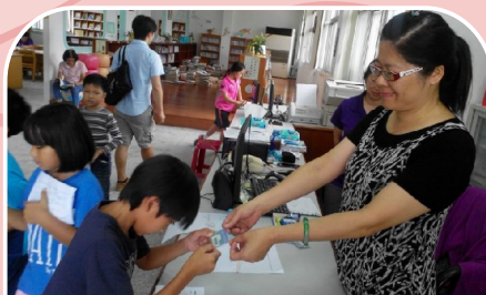
中年級閱讀課參觀公共圖書館