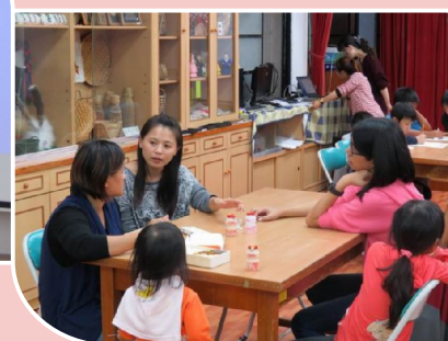
班導與家長溝通閱讀事項