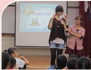
親職教育共讀講座