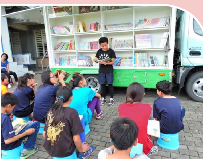
雲水書車閱讀活動