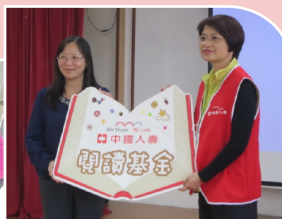
中國人壽贈送閱讀基金