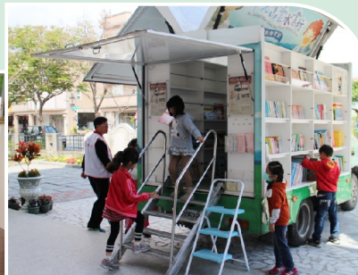
雲水書車行動圖書館開進稻香