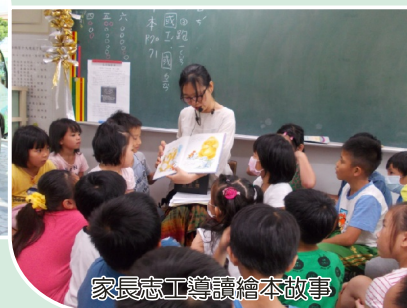
家長志工導讀繪本故事

級學生或替代役一同打造故事花園，訂於每週三早上於圖書室開放低年級全體師生聽動態故事，效果十足，能吸引住每一位師生的目光。