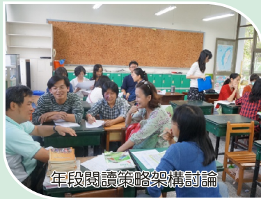
年段閱讀策略架構討論