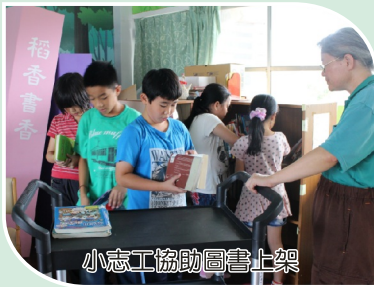
小志工協助圖書上架