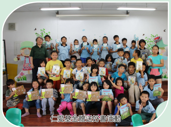
仁愛基金贈送好書活動