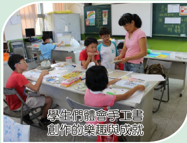
學生們體會手工書創作的樂趣與成就