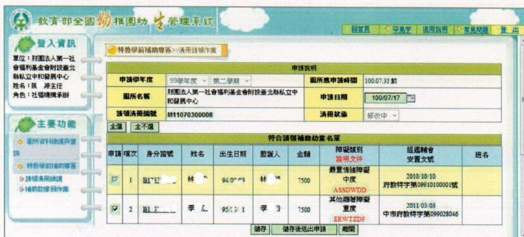
圖 10 已審核清冊修改畫面