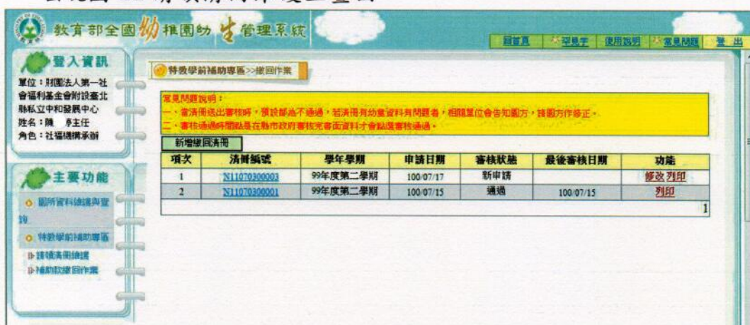
圖 11 補助款繳回清冊維護主畫面