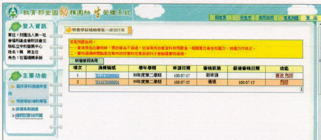
圖 13 補助款繳回清冊查詢結果畫面