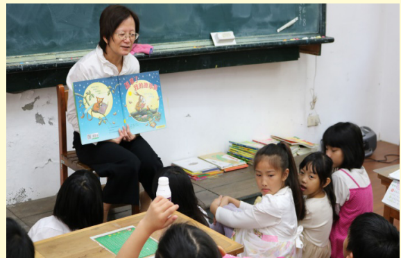
校護惠瓊阿姨說故事