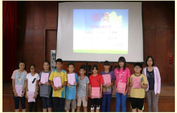
表揚繪本創作的學生