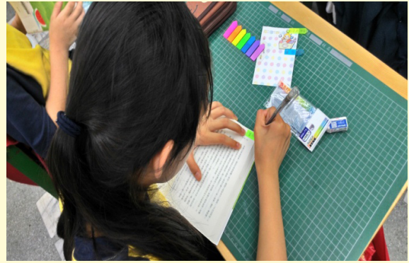
心茹故事大意便利貼