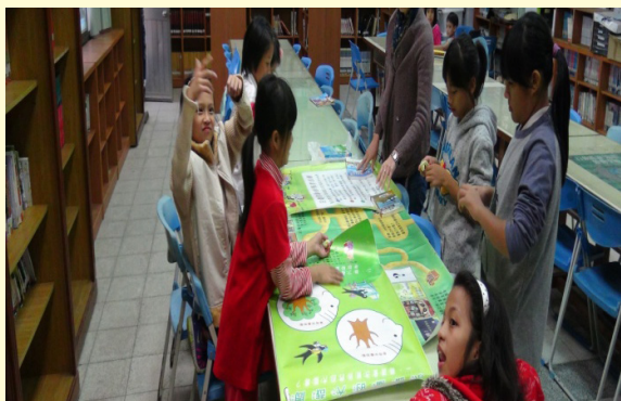
圖書小義工任務說明