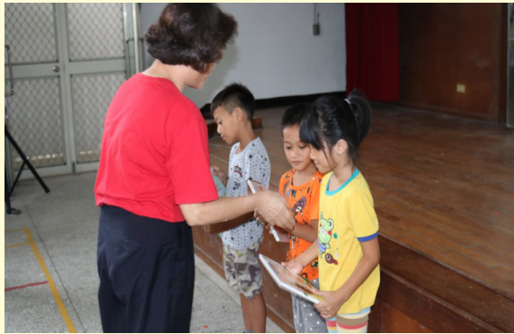
校長致贈新生繪本

「送給小一新生最好的禮物」：每人一份閱讀禮袋，在開學的第一天，辦理了閱讀起步走的各項活動，開啟學生閱讀之窗。