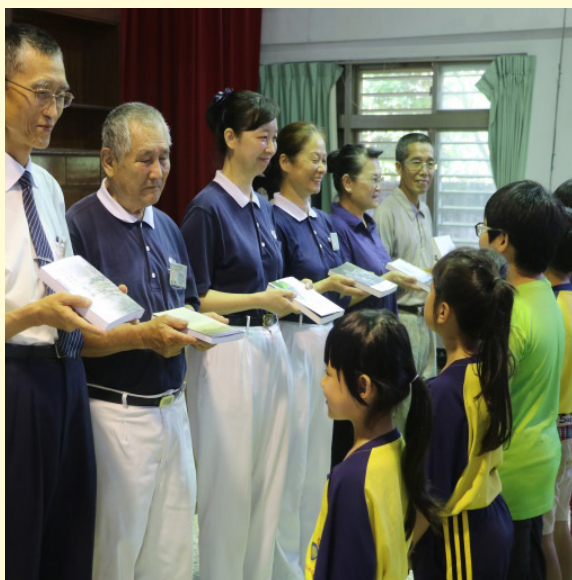
慈濟基金會致贈書籍