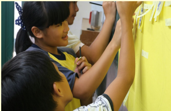
學生貼製家鄉繪本