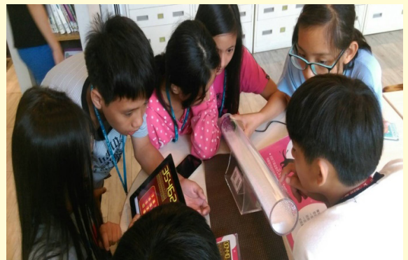
分組進行週刊內容討論