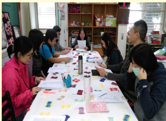
琇惠校長分享圖書應用