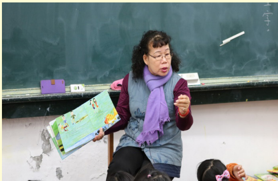
工友美惠阿姨說故事

本校的故事媽媽，除了家長之外，更包含學校的幹事、護士及工友阿姨等，大家一同準備素材，甚至自己製作道具，帶給小朋友不同的刺激及體驗，更增進小朋友的閱讀興趣。