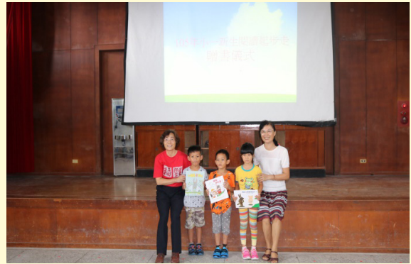
校長與一年級師生合照