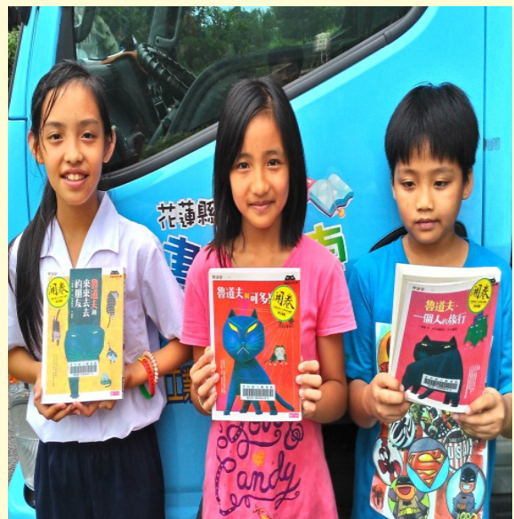
學生展示閱讀書籍