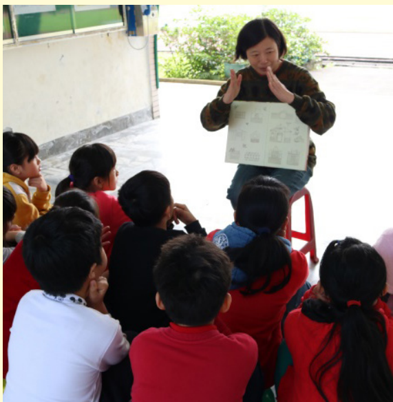
幹事書羽阿姨說介紹列車讀本

這台列車滿載著由各地募集而來的書籍，種類多樣且五花八門，就如同一座小型移動圖書館，透過書香列車的啟動，讓小朋友們有更多機會去接觸書籍，享受閱讀的樂趣。