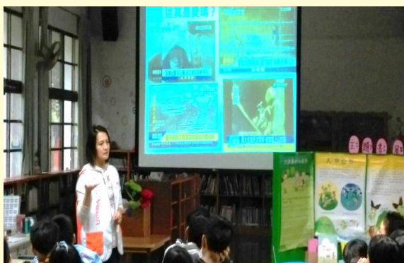
展望會閱讀資源介紹

搭配活動引進外部圖書資源，擺放書展供學生、家長閱讀；或申請民間單位展板或展演，豐富親師生閱讀素材。