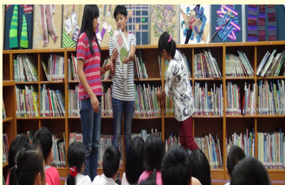
學生志工介紹圖書編目

配合圖書自動化系統，本校圖書管理教師及閱讀替代役、故事媽媽等將全校圖書加以建置，方便學生借閱。