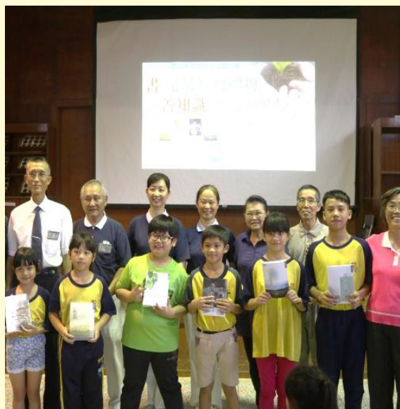
感謝慈濟基金會的捐贈