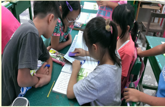
小組討論分段故事