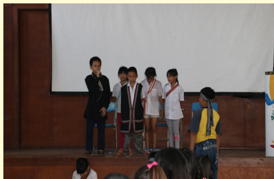
牧師用計讓兩人接受大家祝福