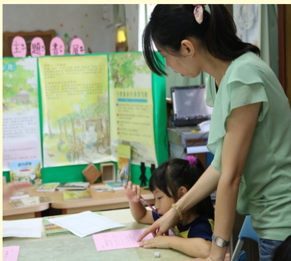
一年級認識圖書室教學

本校圖書館利用教育在教學目標上依照各年級不同程度設計。如：低年級—認識圖書室、圖書室規則、認識書本；中年級—書本結構、圖書分類、閱讀紀錄；高年級—書本結構、資料查詢、閱讀規劃等。在教學活動上則包含老師導覽、分組討論、實做、成果發表等方式進行，增進學生的興趣。