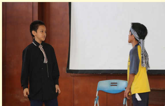
羅密歐向牧師尋求支援