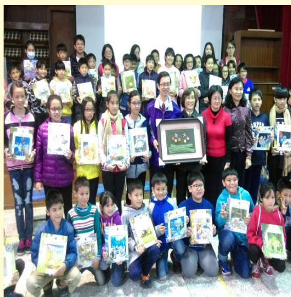
學生拿著獲贈書籍和吳前署長合照