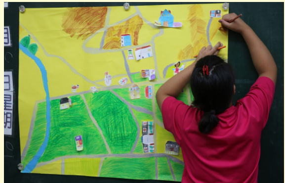
葦樂繪製家鄉繪本