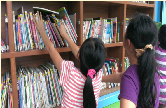
學生翻閱列車書籍