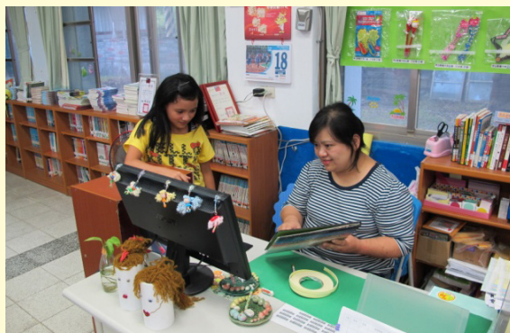
義工媽媽圖書借閱管理