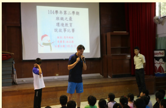
寶賢主任說故事比賽講評