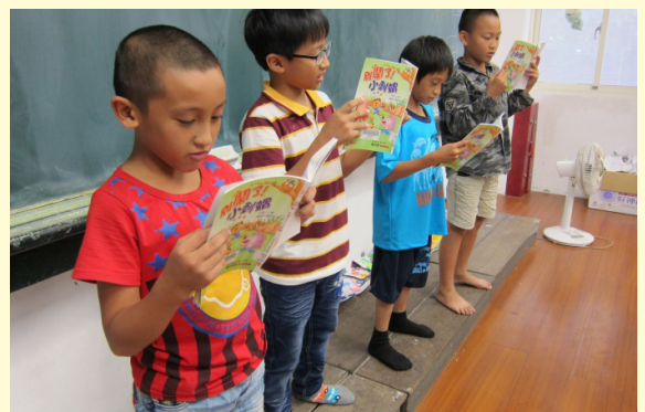
學生朗誦故事內容