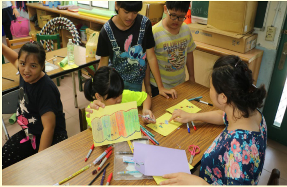
書羽老師指導學生