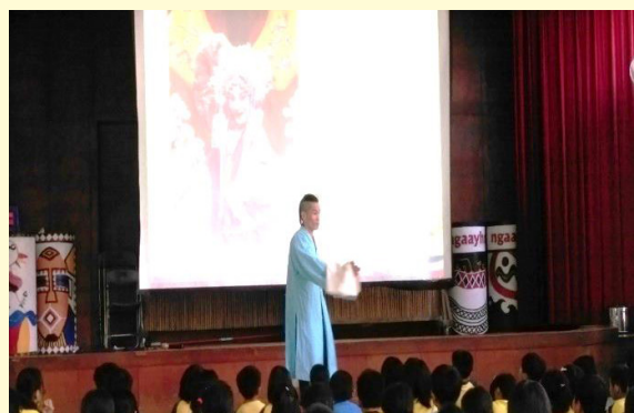
藝術學院介紹國劇戲曲