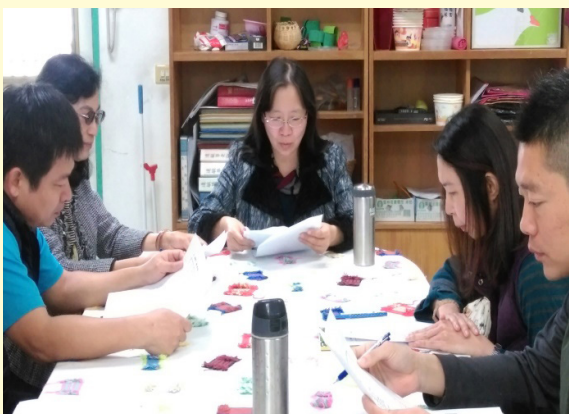
琇惠校長分享圖書應用

圖書教師主要之任務乃在負責學校圖書館之經營、推動閱讀與資訊素養活動、提供資訊協助教師教學，經由研習活動能夠提昇教師教學品質，學生閱讀興趣，並使之具備自學能力。