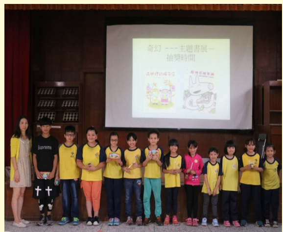
主題書展得獎學生合照