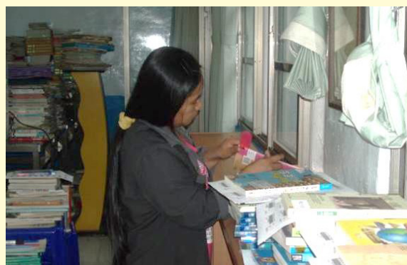
故事媽媽整理圖書