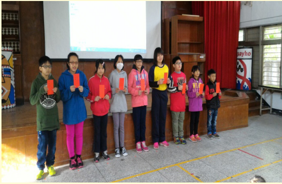
表揚投稿獲得刊登的學生