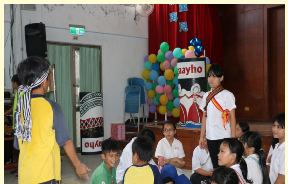
男女主角第一次見面