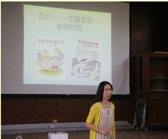
麗敏老師學習單抽獎