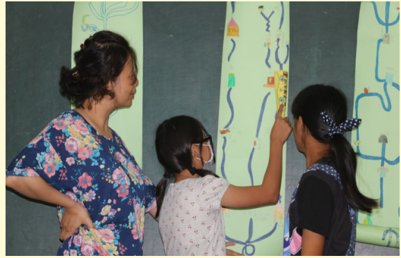
杯圻家鄉地圖分享