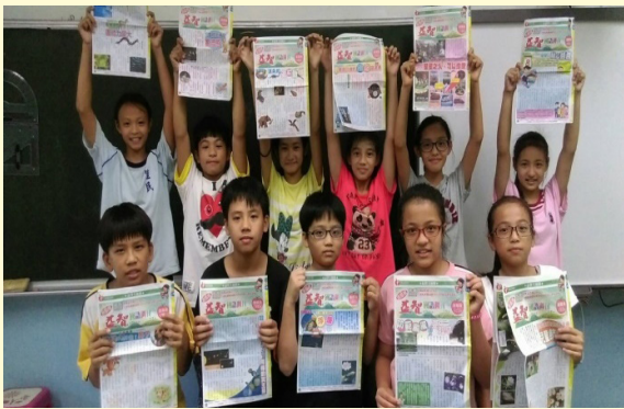
六年級展示所讀報刊

打開眺望世界的窗，拓展眼界心胸寬廣，引進校外社會資源，訂閱國語智慧週刊（低年級初階版、中高年級高階版），讓全校學生利用時間閱讀報紙的知識，從報紙中學習新知。