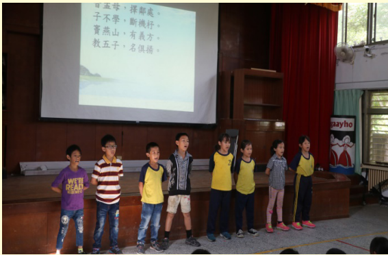
二年級背誦三字經

每週的朝會時間，單週由一、三、五年級，雙週由二、四、六年級學生進行經典的背誦，讓每一位孩子對於經典文句皆能琅琅上口。