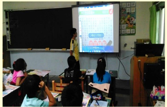
瑞元週刊內容分享