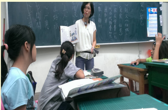
榮美老師分享週刊故事