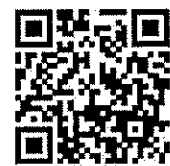
報名 QR CODE