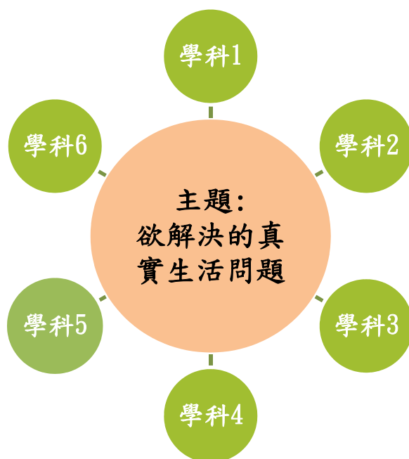
表一、主題跨域課程之課綱關聯圖