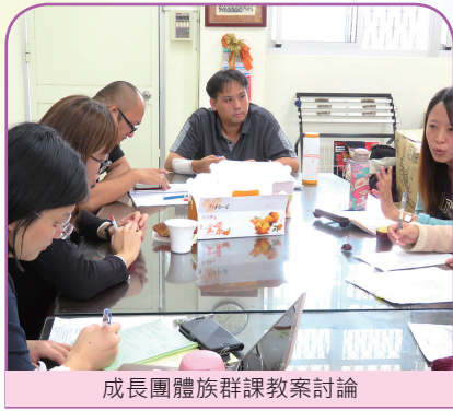
成長團體族群課教案討論