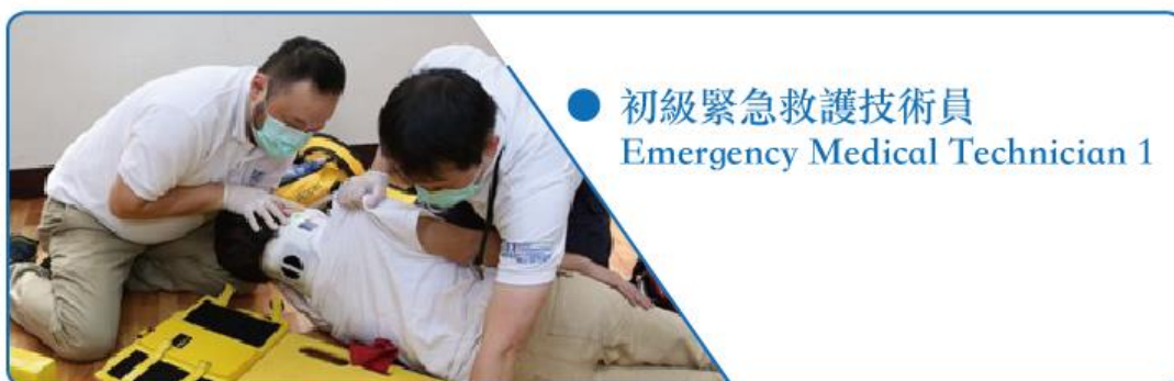
● 初級緊急救護技術員 Emergency Medical Technician 1