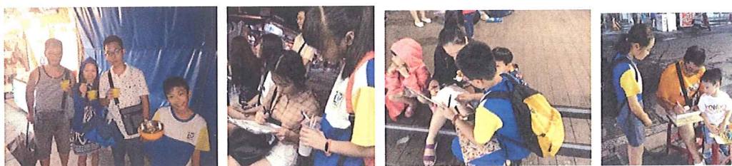
圖 1 至 4 至東大門夜市進行問卷調查

問題刪去後，將最初版問卷請家長試填，並把家長的意見加入調整題意與選項，最後再以心智圖確認各個研究目的細部概念發展補充題目後，再次請家長與指導老師共同檢視問題適切性後，成為正式版問卷，最後特別挑選中秋連假東大門夜市來客數可能最多的時間，以隨機抽樣方式發放問卷 115 份，回收有效問卷 100 份。