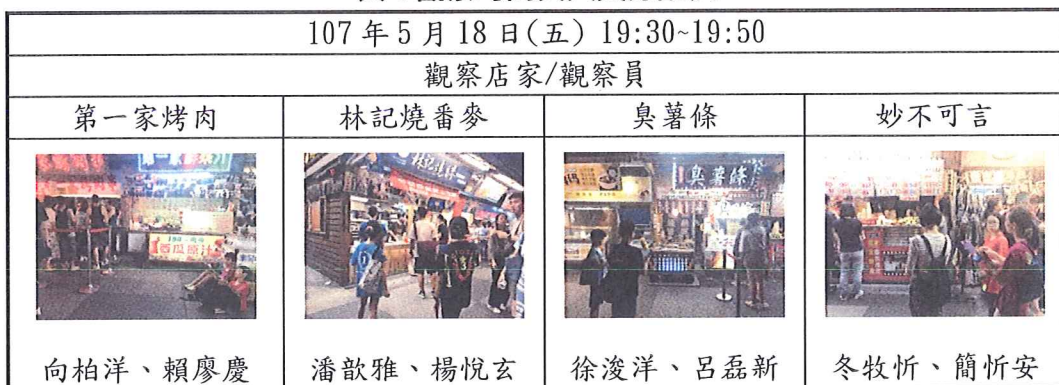
表 1 觀察時間與人員分配表

本研究所用的觀察法是以結構式觀察法，事前由 8 位觀察員討論研究目的中所要觀察的項目，包含塑膠袋、餐盒與紙杯、塑膠吸管、塑膠叉子、塑膠杯、寶特瓶、免洗筷、竹籤、紙袋、其他 塑膠類、其他非塑膠類、環保杯、環保餐具、環保袋、其他環保餐具等 16 項，每位觀察員依據顧客所購買的食物包裝進行逐項統計個數，每個研究對象由兩名觀察員進行觀察，並將觀察結果紀錄在統一的紀錄表中，最後再計算觀察的一致性，以確保觀察結果的信度。