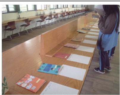
圖書館展演活動小書創作比賽 作品展