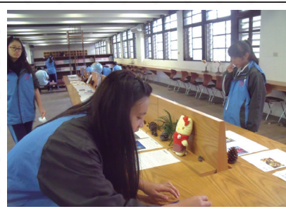
校內學生參與聖誕特展