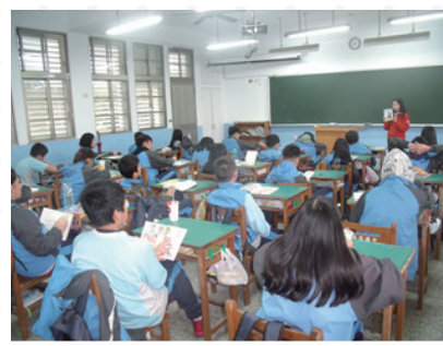
圖推教師入班好書導讀