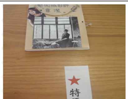
小書創作特優作品