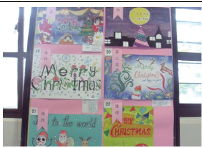
聖誕創意比賽海報