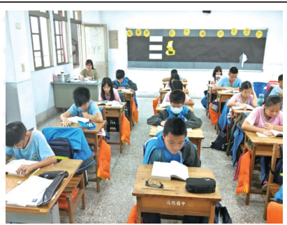
新生閱讀推廣 - 一人一本好書