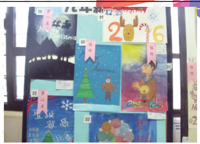
聖誕創意比賽海報