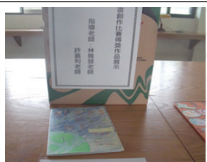
圖書館展演活動小書創作比賽 作品展