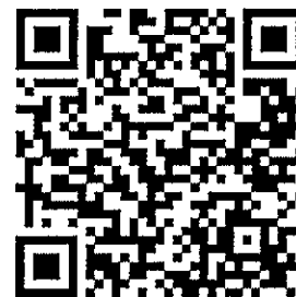
報名頁面 QR code