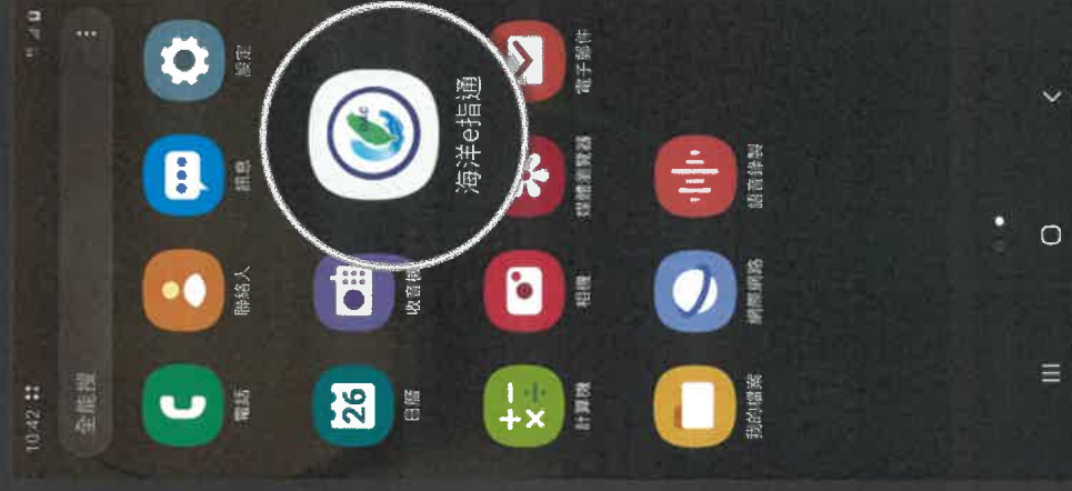
4. 安裝完畢後 出現在主畫面