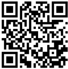
國立空中大學推廣教育中心 網站 QR Code