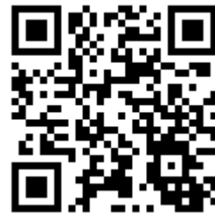
國立空中大學推廣教育中心 臉書粉絲專頁 QR Code