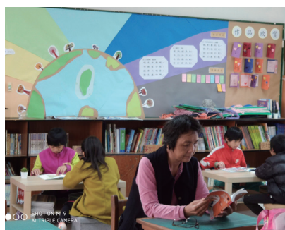
行政人員身教式閱讀