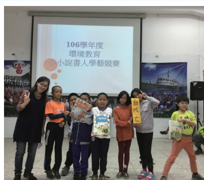
小小說書人學藝競賽