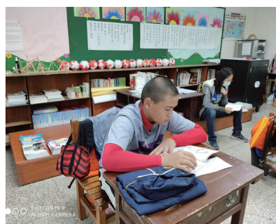
學生聚精會神閱讀