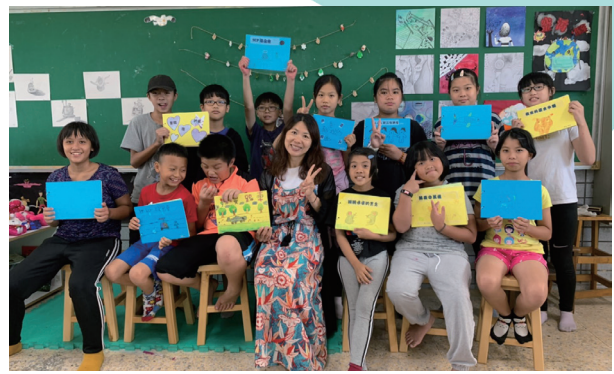
中高年級暑期繪本營