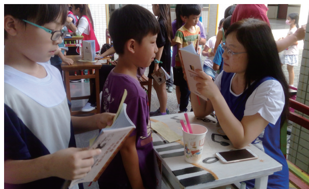
學生踴躍參加讀經會考