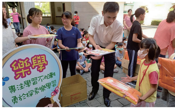
新生歡迎暨友善校園週