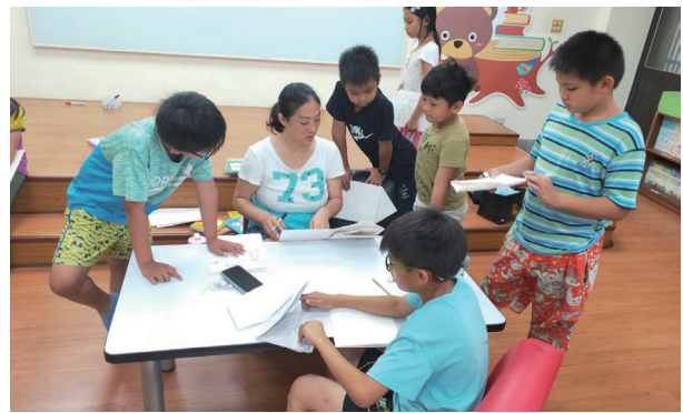
暑期繪本營上課情形