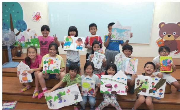
低年級暑期繪本營