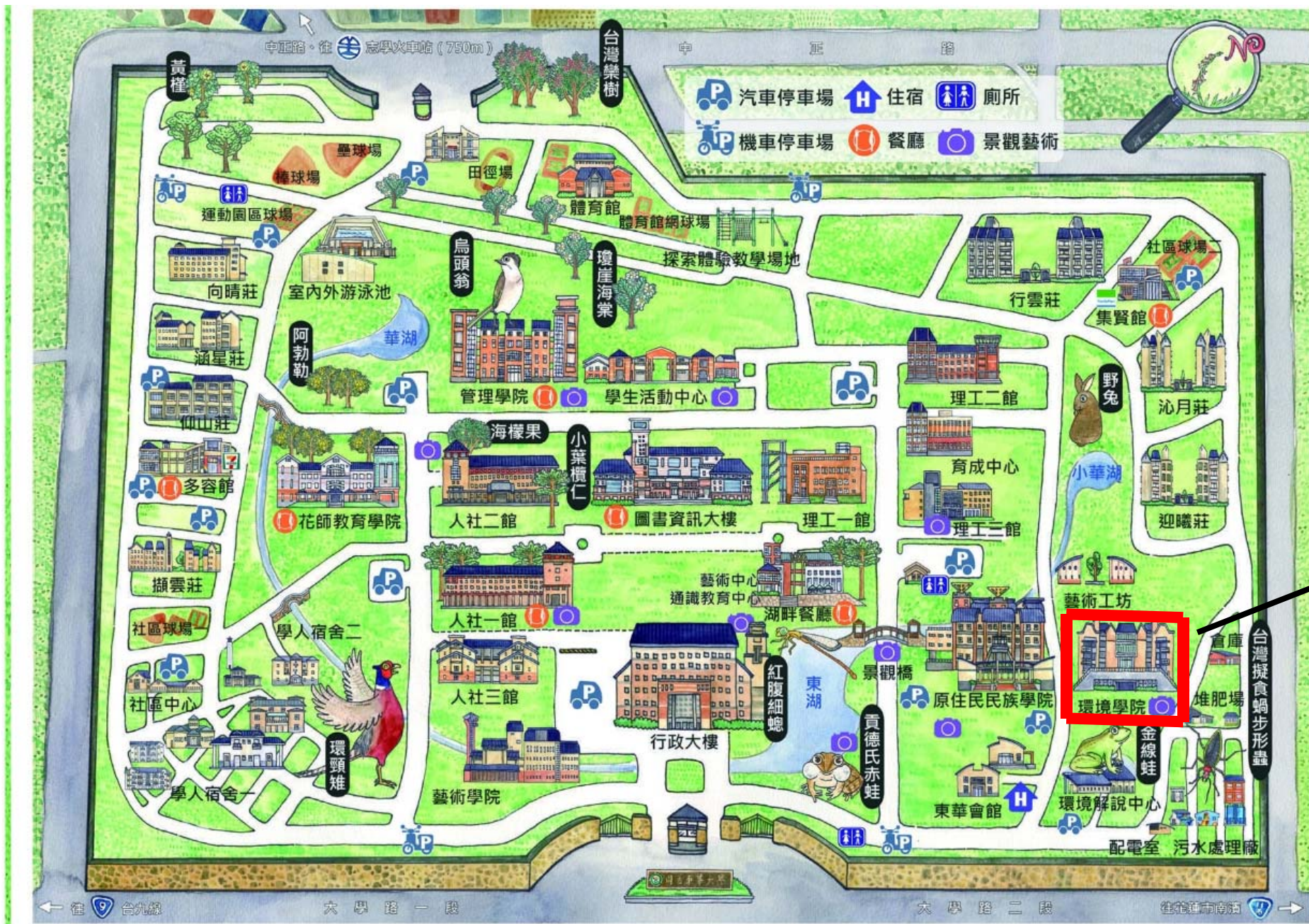
上課地點：環境學院校園位置示意圖