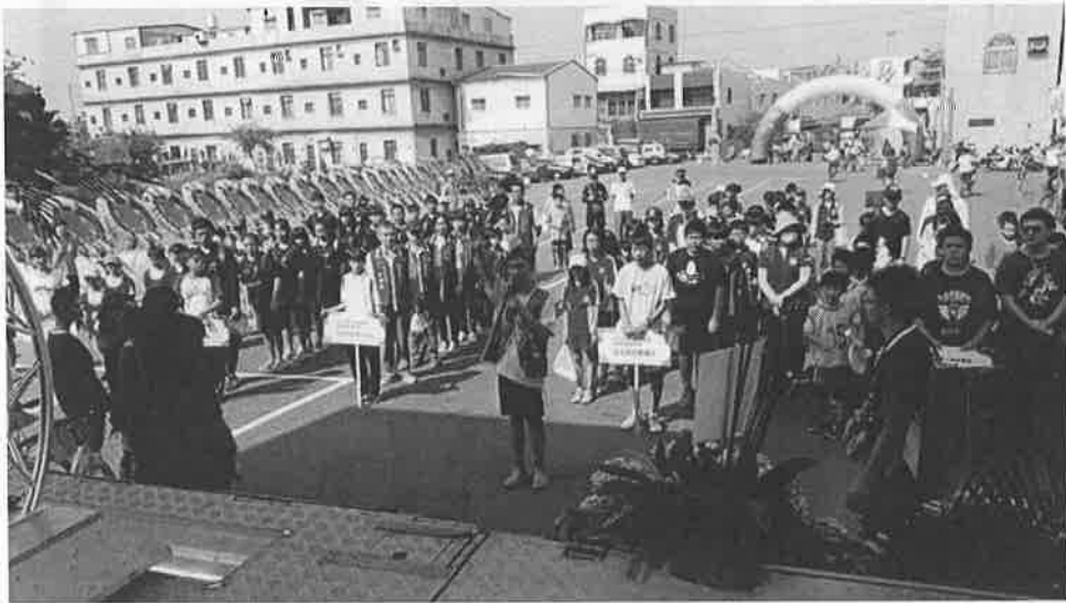
第一屆良閣盃照片