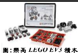
圖：樂高 LEGO EV3 積木