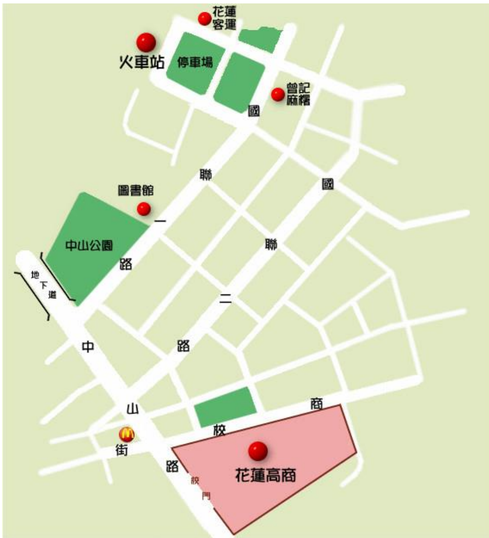
附圖一 承辦學校位置圖