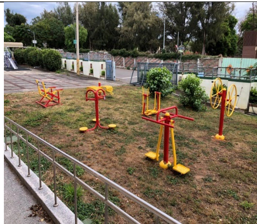
宿舍外有籃球場及遊樂設施