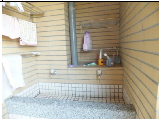
寢室設有洗衣台及曬衣空間