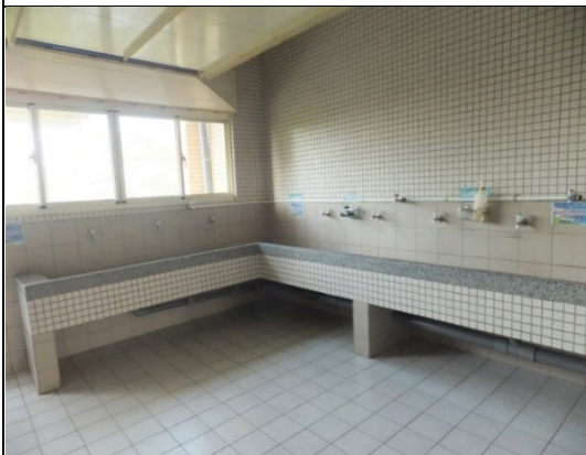
公共區設有洗衣空間和脫水機